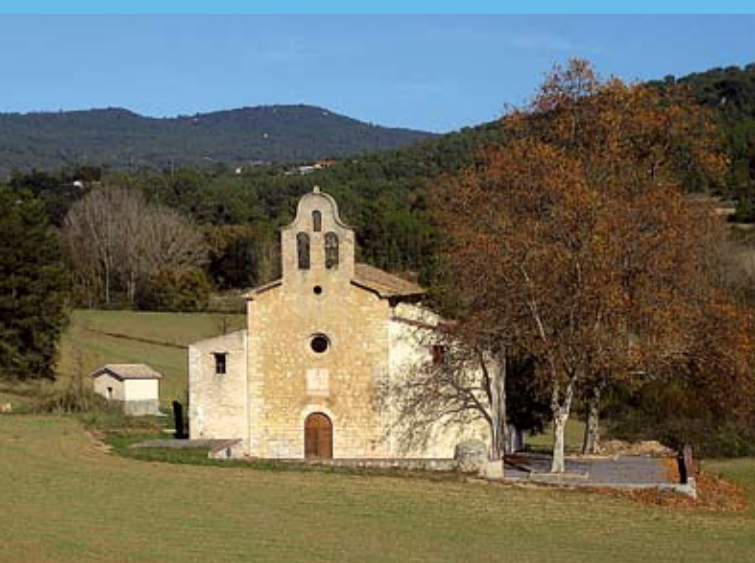
Santa Maria de Valldossera

El Castell de Querol sofrí amb el temps diverses vicissituds i, finalment, el 1835, una partida de liberals el prengueren i el van enderrocar quan estava ocupat per un grup carlí.