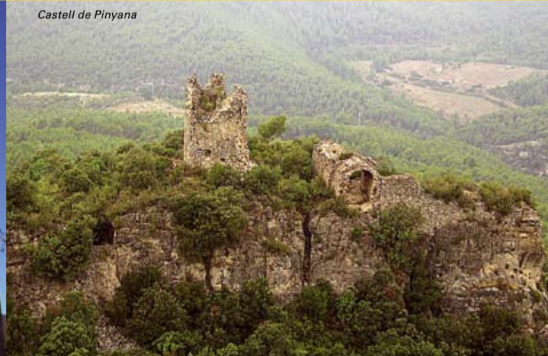
Castell de Pinyana

Iglesia de Santa Maria - Situada en la parte alta de Querol, a pesar de haber sufrido diversas modificaciones, es de origen medieval y está formada por una sola nave con bóveda apuntada.