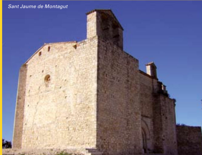
Sant Jaume de Montagut

Arbres monumentals - Dins el terme de Querol també hi ha dos arbres catalogats com a arbres monumentals. Un és el pi de les quatre soques, impressionant pi amb quatre troncs de fins a 20 metres d'alçada cadascun. L'altre és l'alzina de la Casa Nova de Bonany, d'uns 400 anys, de 13,5 metres d'alçada.