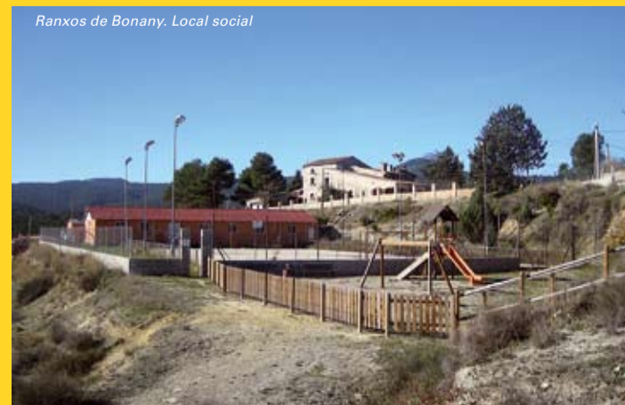
Ranxos de Bonany. Local social

Monumental trees - Querol district is home to two trees that are listed as monumental trees. One is the four-stumped pine tree, an impressive pine tree with four trunks, each of which is 20 metres high. The other one is the 400 year old holm oak located at the Casa Nova de Bonany, which is 13.5 metres high.