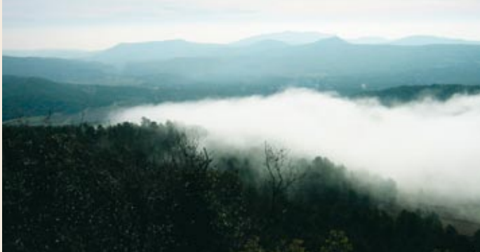
Cim del puig Formigosa

tot i ser un pèl més elevat que el seu veí, Montagut (964 m), no gaudeix ni de bon tros de les perspectives que es poden albirar des d'aquest altre punt.