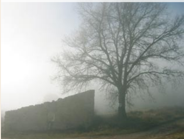
Cases Noves de Formigosa